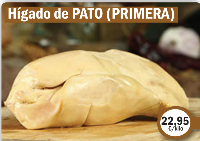
Hígado de PATO (PRIMERA)