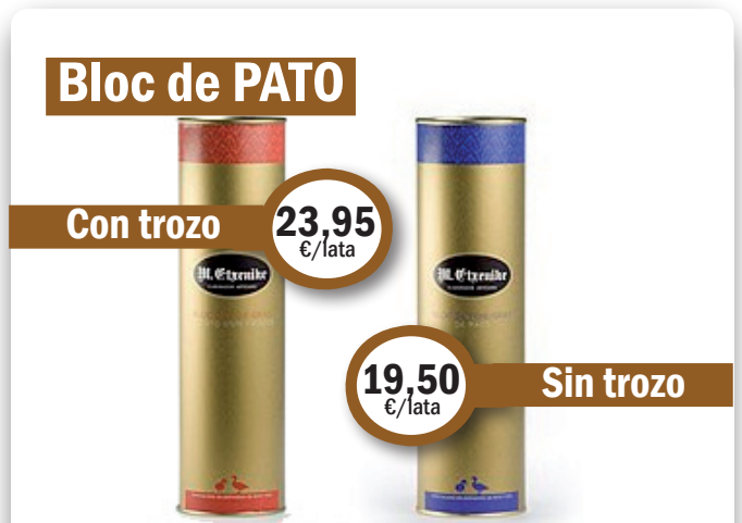
Bloc de PATO