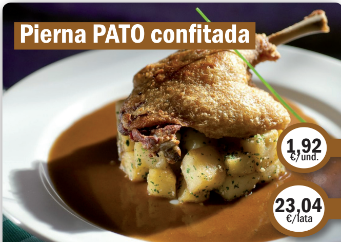
Pierna PATO confitada