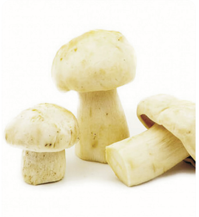
PERRETXIKO silvestre nacional