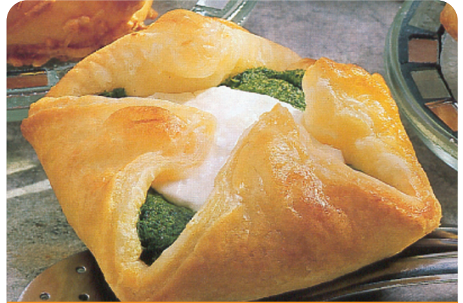
CESTA queso cabra