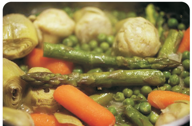
MENESTRA de verduras