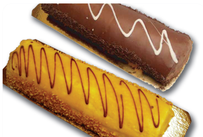
BRAZO de crema y chocolate