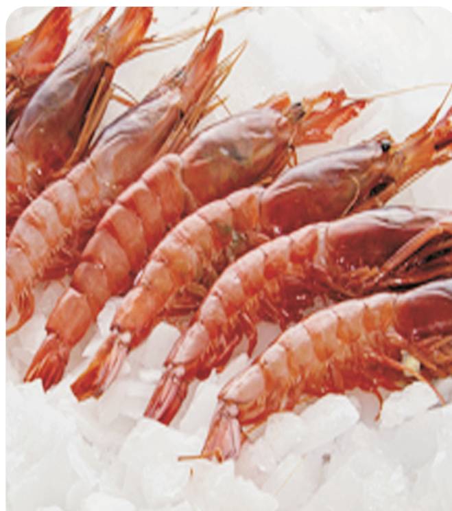
GAMBA roja Atlántico abordo