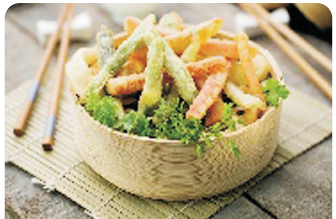
VERDURAS en tempura