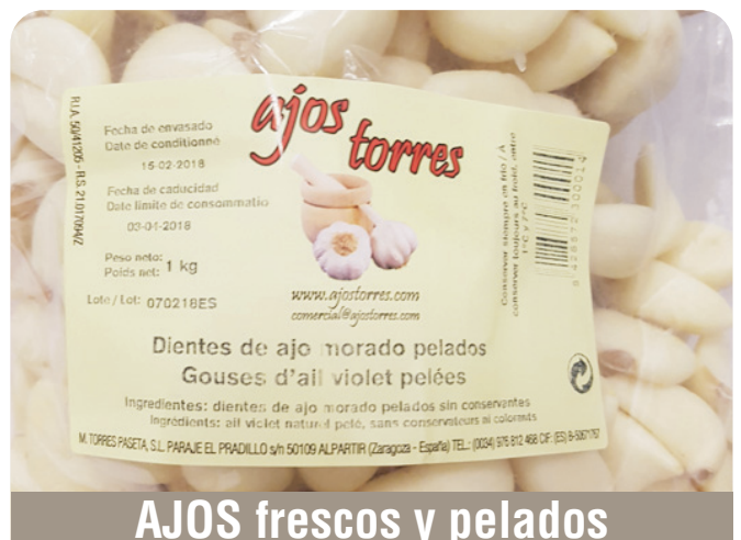
AJOS frescos y pelados