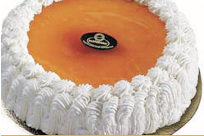
TARTA San Marcos