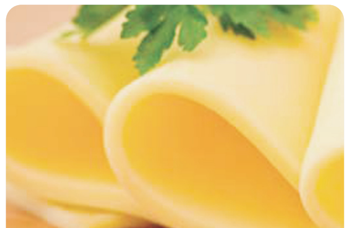
Queso EDAM loncheado