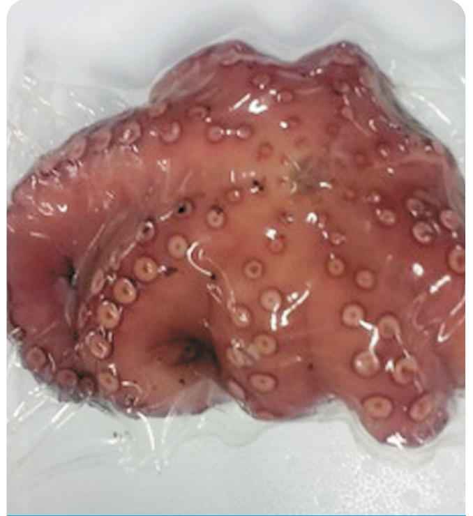
PULPO de Marruecos