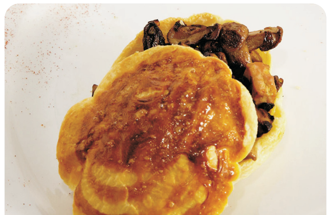
HOJALDRE foie y hongos