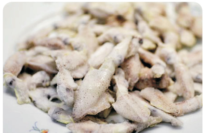
Puntilla de CALAMAR