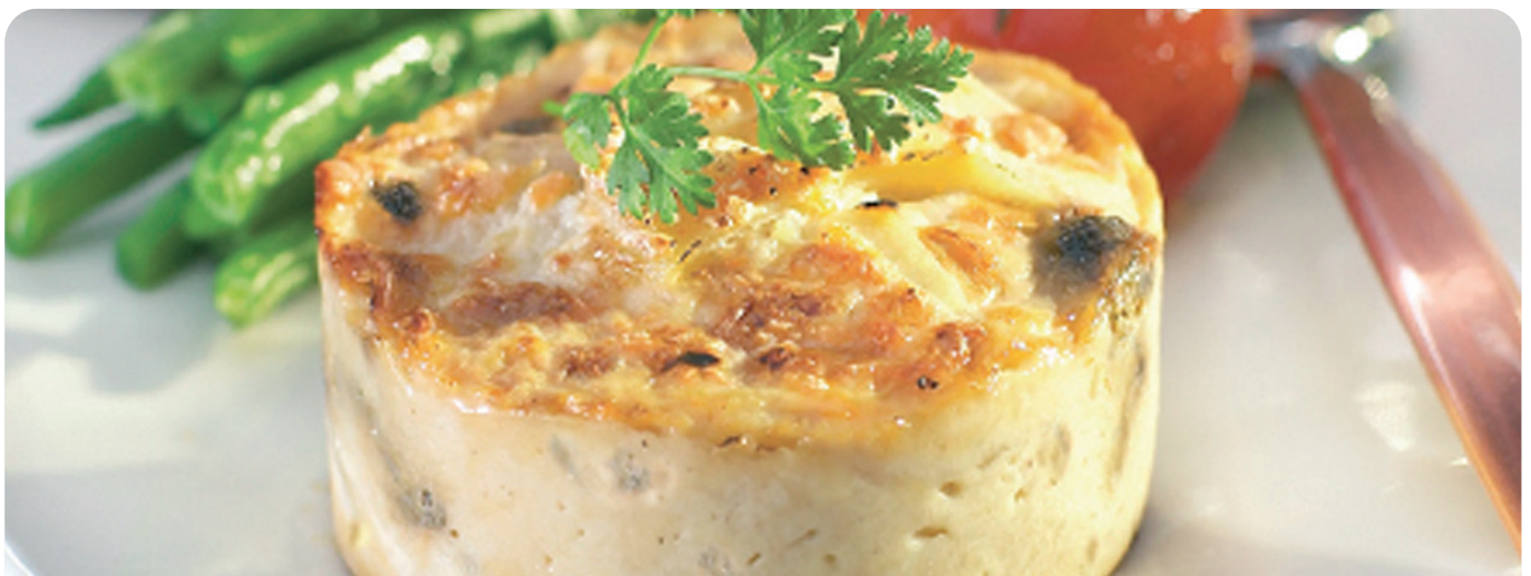
GRATINADO patata con boletus