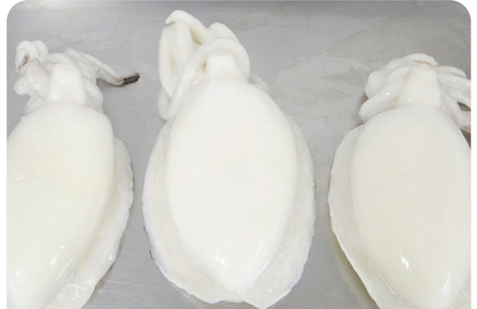
SEPIA de Marruecos