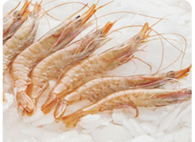
GAMBA blanca Mediterráneo