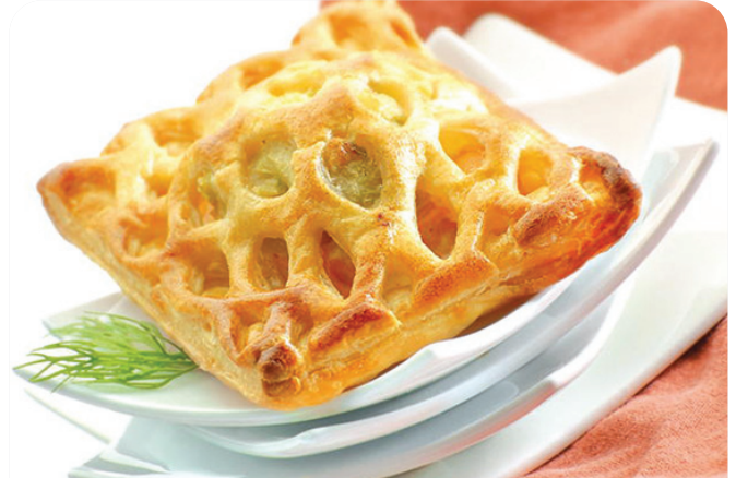
HOJALDRE salmón y puerro