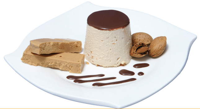
FLAN turrón almadrado con salsa de chocolate