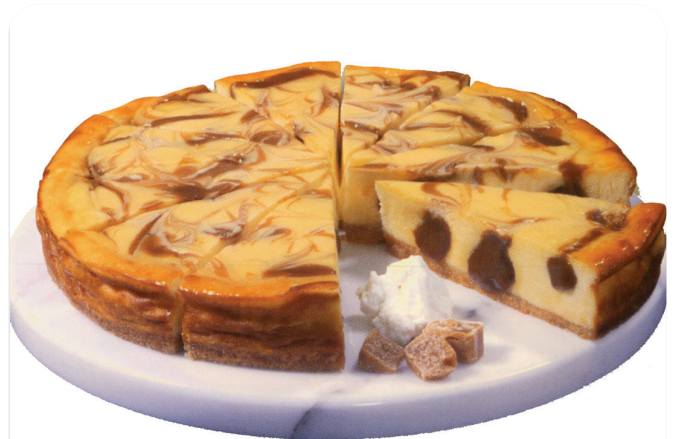
TARTA dulce de leche