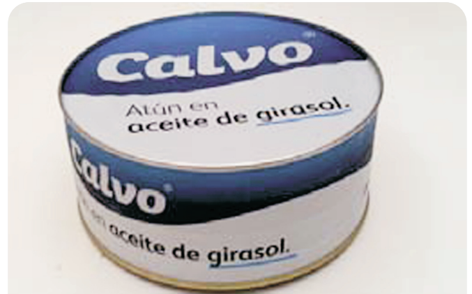
Migas de ATUN