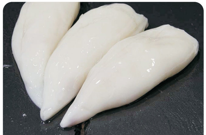
CALAMAR patagónico limpio