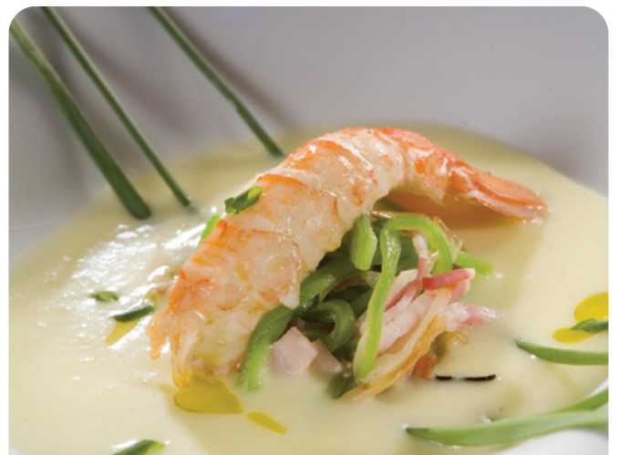
CIGALA Islandia colas