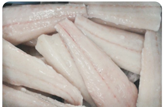
MERLUZA Cantábrico colas