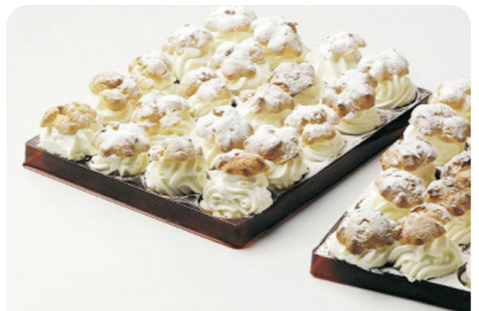
BOCADITO de nata