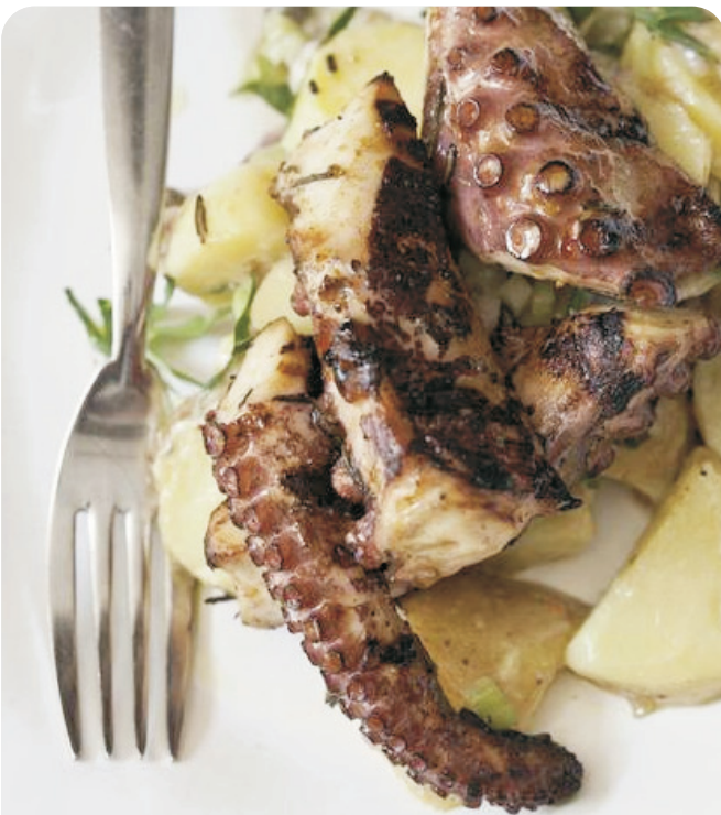
Patas de PULPO