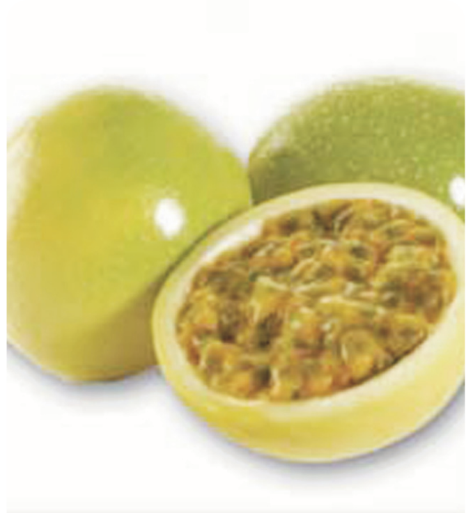
PURE de maracuyá