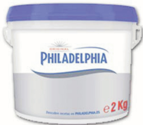
Queso PHILADELPHIA 2 kg.