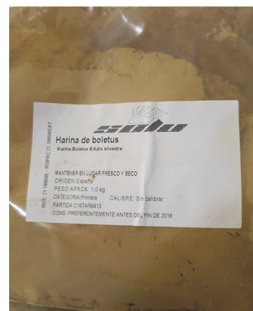
Harina de BOLETUS