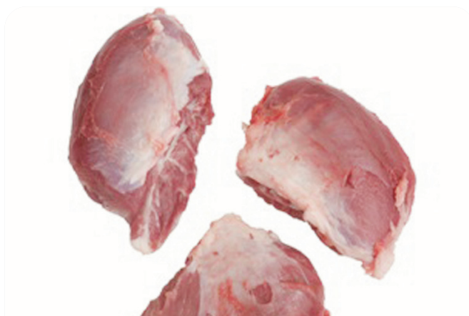
Carrillera CERDO ibérico