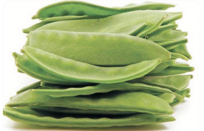
JUDIA VERDE plana