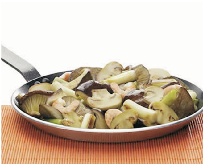
SALTEADO de ajos, gambas y setas