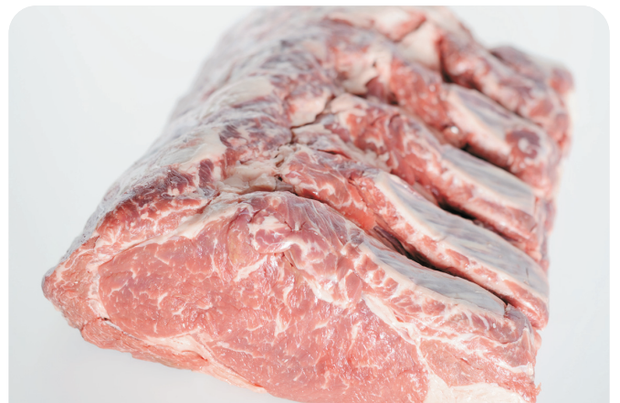
ENTRECOT vacuno lomo alto