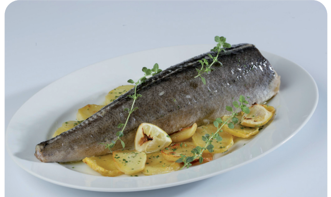
MERLUZA entera n.z.