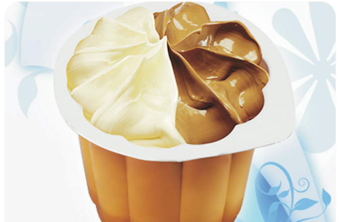
VASITOS sin azúcar, choco-vainilla