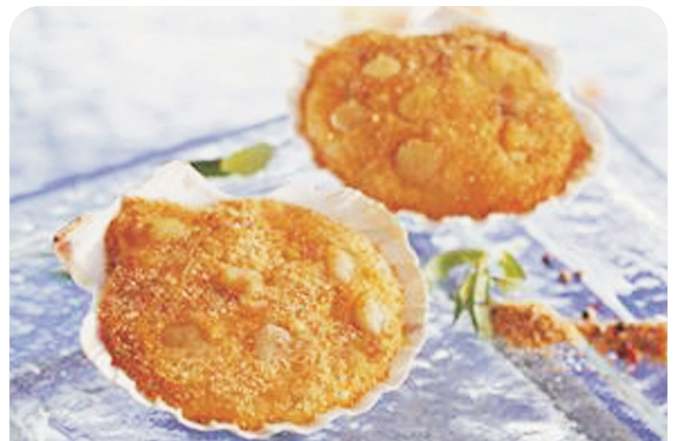
CONCHA vieira gratinada