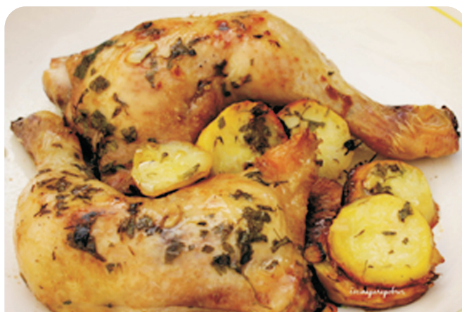
POLLO cuartos traseros