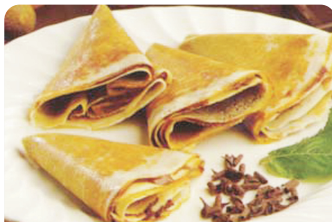
CREPE de chocolate