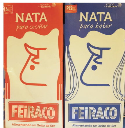
NATA montar y cocinar