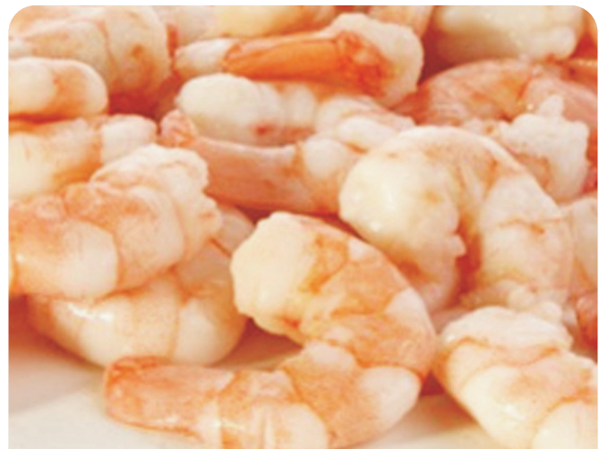
GAMBA pelada sin agua