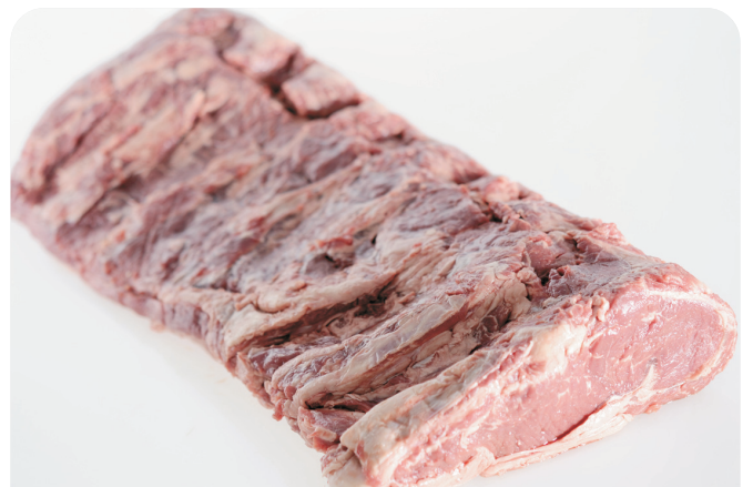
ENTRECOT vacuno lomo bajo