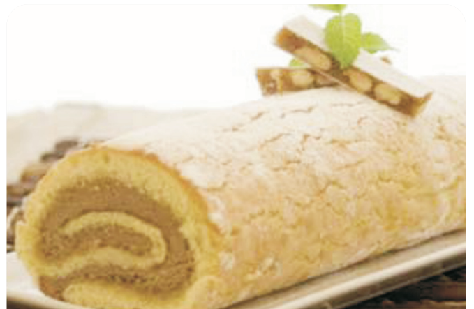
PLANCHA bizcocho enrollable