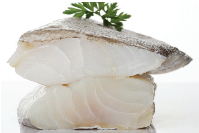
BACALAO lomo jumbo