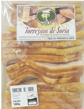
TORREZNOS de Soria