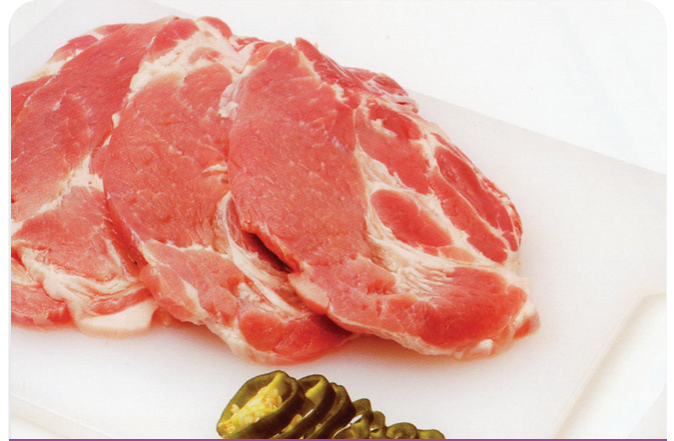
Chuleta CERDO aguja