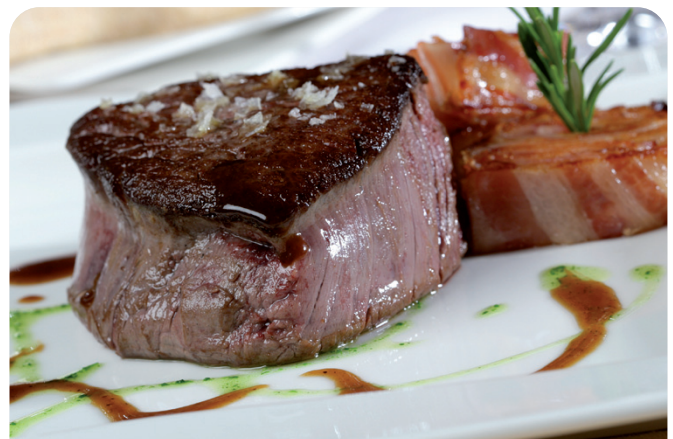
Solomillo TERNERA porcionado