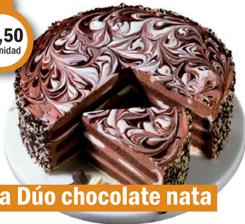
Tarta Dúo chocolate nata