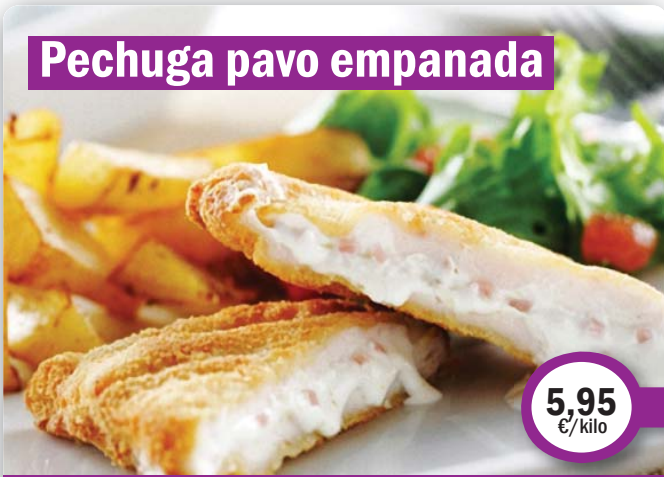
Pechuga pavo empanada