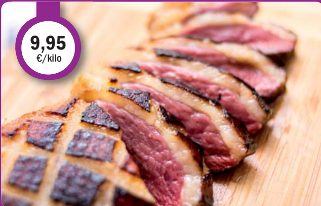
Magret de PATO