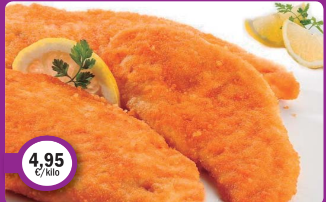
Pechuga POLLO empanada