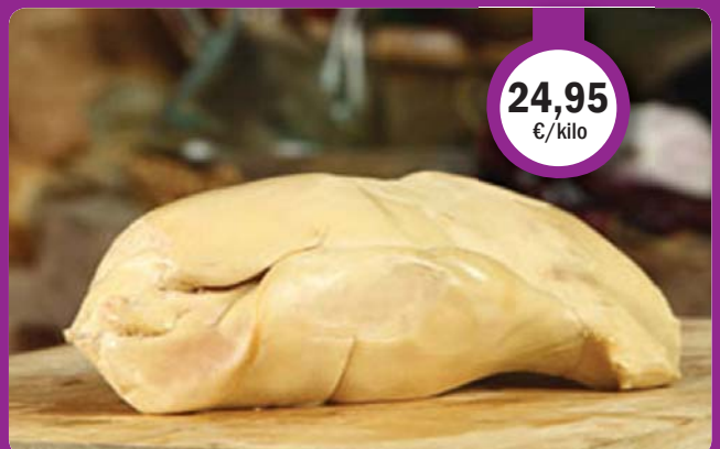
Hígado de PATO (primera)