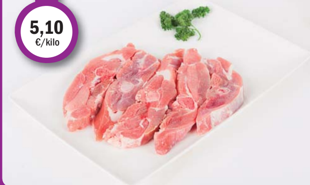
PAVO chuleta sazonada