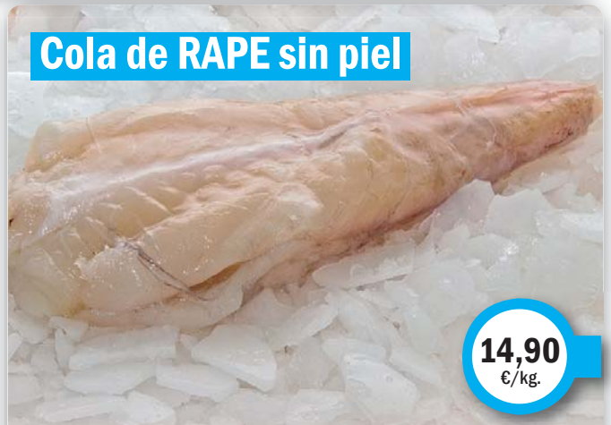
Cola de RAPE sin piel