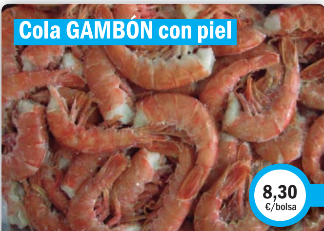
Cola GAMBÓN con piel