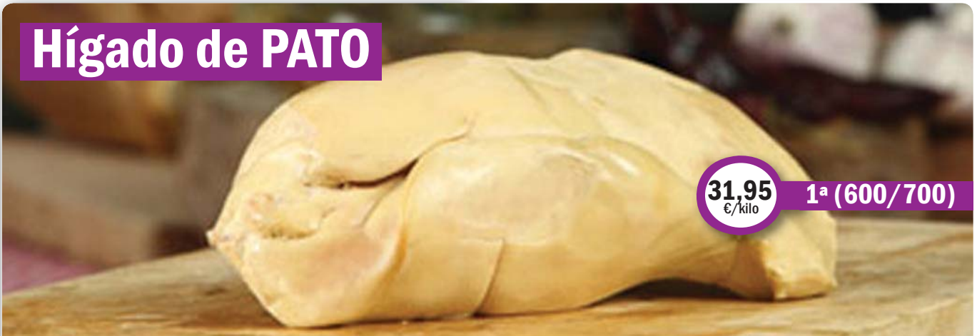
Hígado de PATO