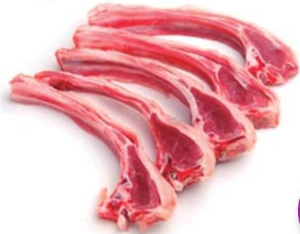
Costillas CORDERO lechal