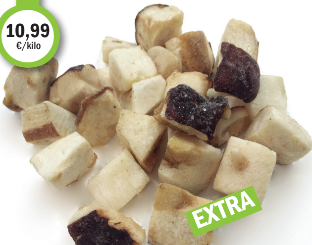
HONGO boletus troceado