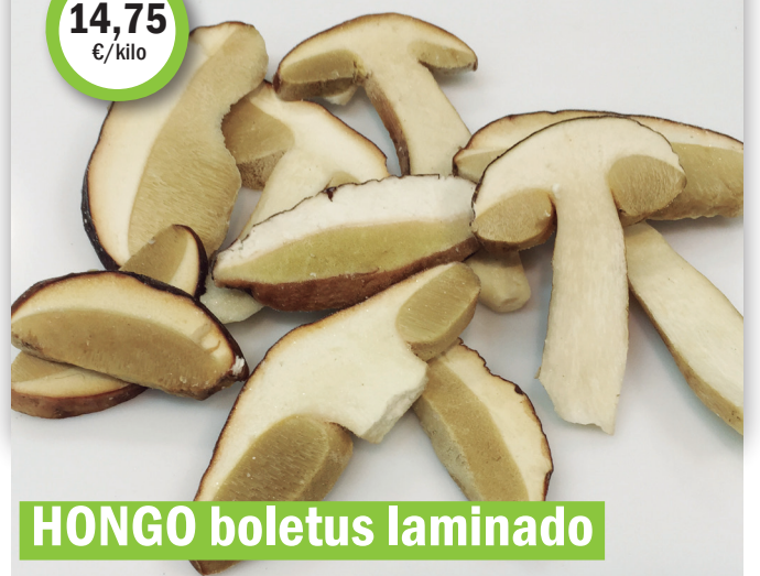
HONGO boletus laminado