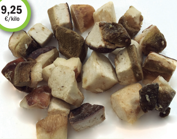
HONGO boletus trozo